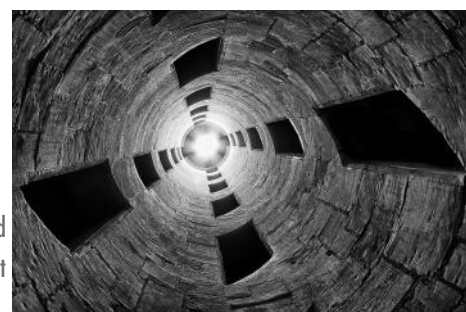
Escalier de Chambord Philippe Flouret