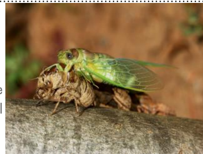
Naissance d'une cigale Suzanne Bayol

En N&B Michel Lepelley se classe 3e sur 144 avec "Les boucles de Kotor"; en couleur, Didier Carret se classe 6e sur 260 avec "Echouage".