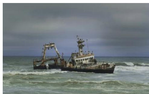
Echouage Didier Carret