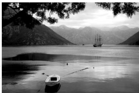
Les boucles de Kotor Michel Lepelley