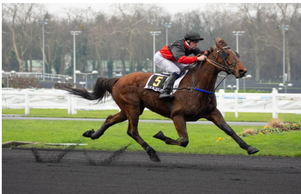
Vincennes Le clan des "trotteurs"